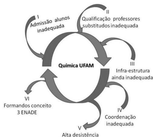
Figura 3 – Ciclo da formação dos químicos na UFAM.

Uma das melhorias que a UFAM deveria implantar é o aperfeiçoamento de seu processo de seleção do PSC. Infelizmente, o processo é usado somente como forma de estabelecer uma pontuação que é usada para a escolha do curso. Por outro lado, deveria introduzir um processo de avaliação que permitisse estabelecer políticas públicas adequadas aos problemas regionais. Como uma ferramenta fundamental, os resultados gerais do PSC poderiam ser utilizados pela instituição para melhorar a qualidade do ensino médio no Estado do Amazonas.