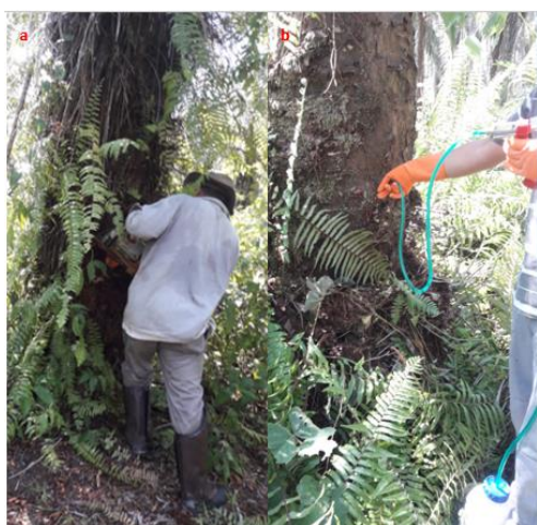
Figura 1. Procedimento para aplicação dos tratamentos: (a) realização do furo em dendezeiro com broca acoplada em motosserra; (b) Injeção do herbicida com auxílio de seringa automática de fluxo contínuo.

Onde, Y_i e Y_{i+1} são os valores de incidência dos sintomas observados em duas avaliações consecutivas, t_i e t_{i+1} o período de tempo referente a cada avaliação e n a duração do período de avaliação.