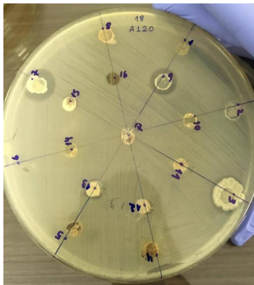
Figura 2. Halos de inibição de Streptomyces spp. e Bacillus spp. frente a Aeromonas spp.

zona de inibição de 10 a 35 mm, sendo AQB S2 e AQB S4 se mostraram altamente ativos na inibição e AQB S e AQB S3 exibiram atividade moderada, utilizando o método de antibiograma (Dharmaraj, 2010).